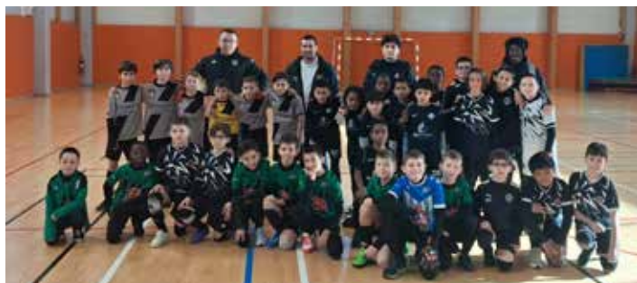
Plateau U 11 Féfis-Lahitte à Moncontour : Les équipes OA.S.M. – GJ VVM CHAUVIGNY1 – OZON 1 – Stade POITEVIN 1