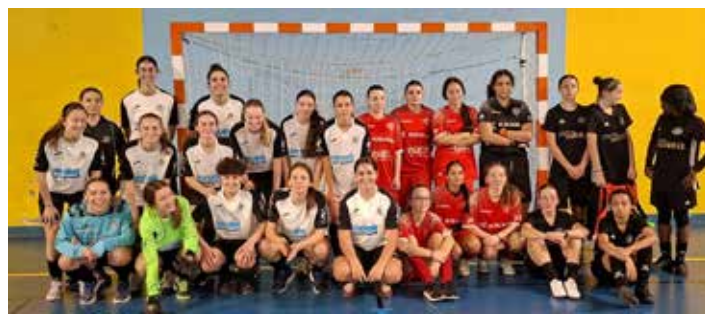
Plateau U 18 F Futsal à Montmorillon