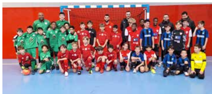
Plateau U11 G - Féfis-Lahitte à Latillé : Les équipes GJ CAP HAUT POITOU 1 – POITIERS CEP 1 – SO CHATELLERAULT 1 - St BENOIT 1