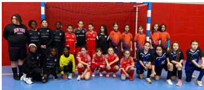
Plateau U11 F Féfis Lahitte à Latillé