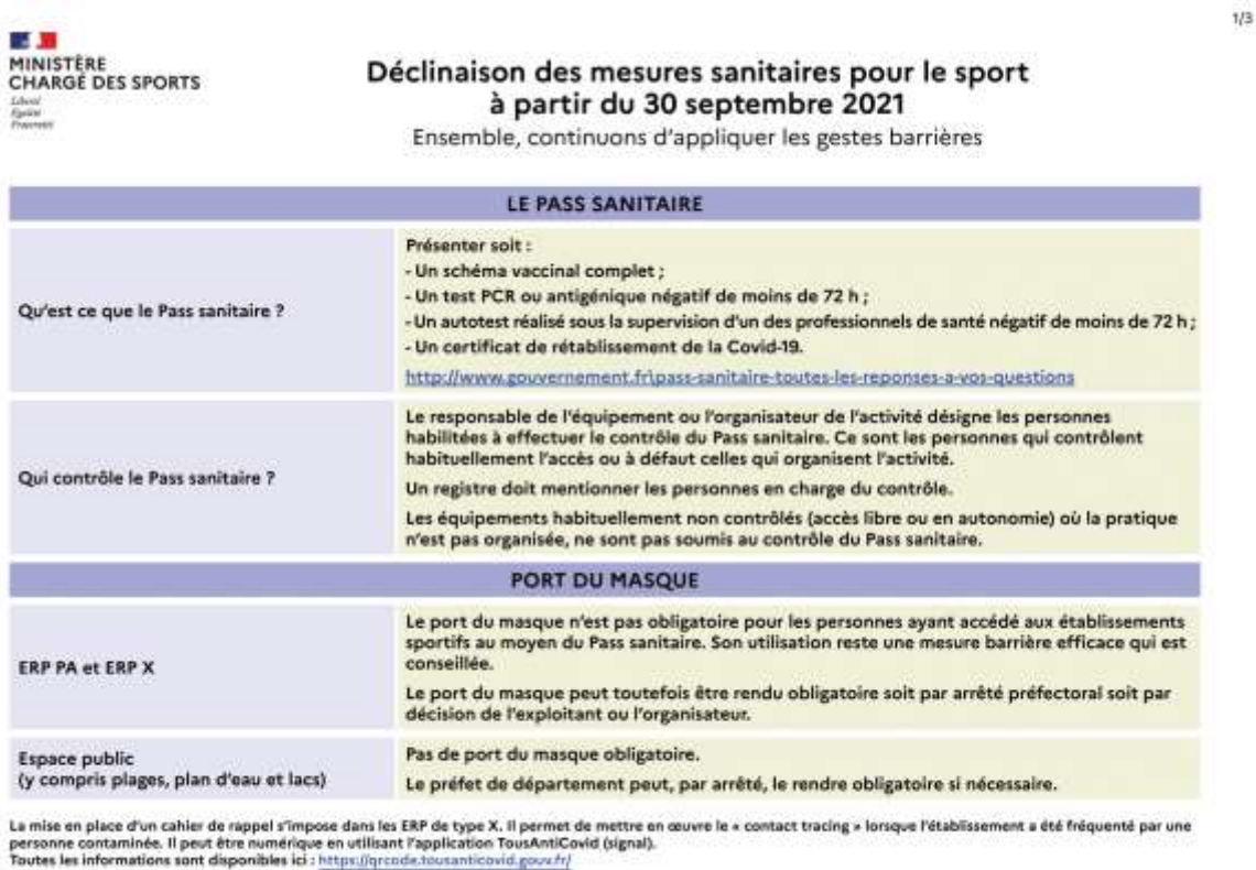
TABLEAU DES MESURES SANITAIRES POUR LE SPORT – MAJ DU 30-09

Nous conseillons à ce qu'à minima, les coordonnées des membres du bureau du club soient diffusables (numéro de téléphone et adresse mail).