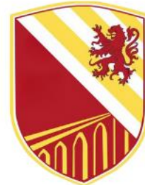
Usson l'Isle Jourdain